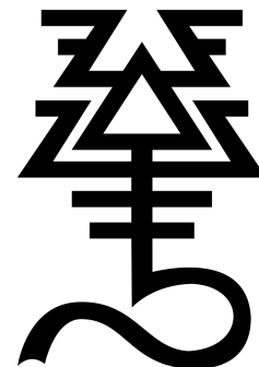
Rune du "Dieu aux mains sanglantes"

Seuls les Rangers et les Marcheurs de combat peuvent se déployer en garnison.