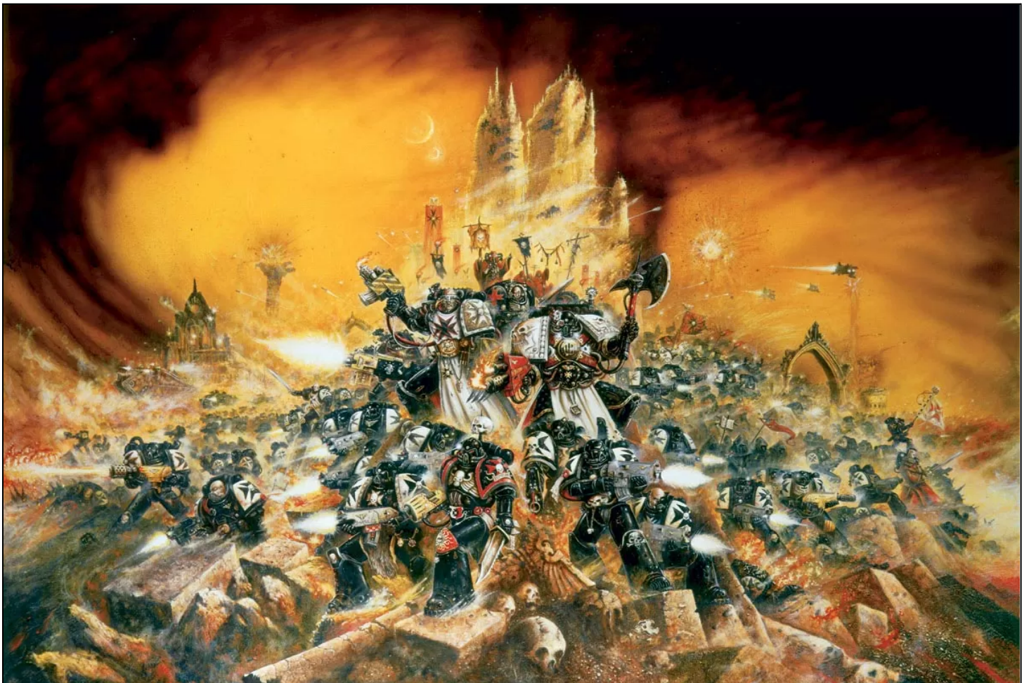
Black Templars défendant la cité ruche de Helsreach pendant la Troisième Guerre d'Armageddon.

Si plusieurs formations utilisent des Modules d'atterrissage, placez tous les marqueurs Module d'atterrissage aux coordonnées prédéterminées en utilisant les règles d'Assaut Planétaire (y compris la résolution de dispersion). Une fois que tous les marqueurs sont placés, résolvez toutes les attaques des Modules d'atterrissage simultanément contre les formations ennemies à portée des marqueurs Module d'atterrissage. Les formations visées recevront un pion impact pour le tir pour chaque attaque du vaisseau ou des modules d'atterrissage. Les pertes et les tirs ruptures infligent des PI normalement. Puis débarquez toutes les formations transportées, en suivant les règles ci-dessus.