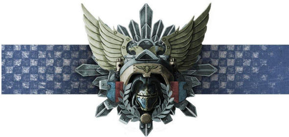
Emblème des maisonnées de Chevaliers.

Chaque Lance peut recevoir des améliorations . La liste d'armée indique pour chaque lance quelles améliorations sont autorisées. Chaque amélioration autorisée ne peut être prise qu'une fois par lance sans autre contrainte. Les améliorations font partie intégrante des Lance et doivent respecter les règles de cohésion. Certaines améliorations ajoutent des chevaliers supplémentaires alors que d'autres ajoutent des personnages. Ces personnages sont des pilotes de ce fait, chaque véhicule ne peut recevoir qu'un seul personnage .