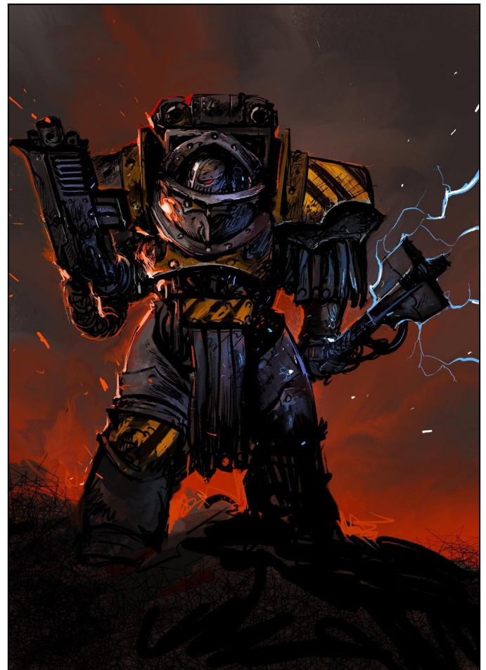
Sergent vétérane Iron Warrior en armure Terminator datant de la période pré-hérésie.

*les (X) indiquent le nombre d'unités maximum pouvant occuper ces fortifications par tronçon de 4 cm de longueur.