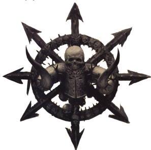
Icône de guerre d'une loge non identifiée.

Chaque Loge Renégate , Formation du Chaos Universel et Formation de Démons peut recevoir des améliorations . La liste d'armée indique pour chaque formation quelle amélioration est autorisée. Chaque amélioration autorisée ne peut être prise qu'une fois par détachement pour un maximum de quatre par formation. Les améliorations font partie intégrante des formations et doivent respecter les règles de cohésion. Noter que certaines améliorations remplacent des unités d'une formation tandis que d'autres ajoutent des unités supplémentaires.